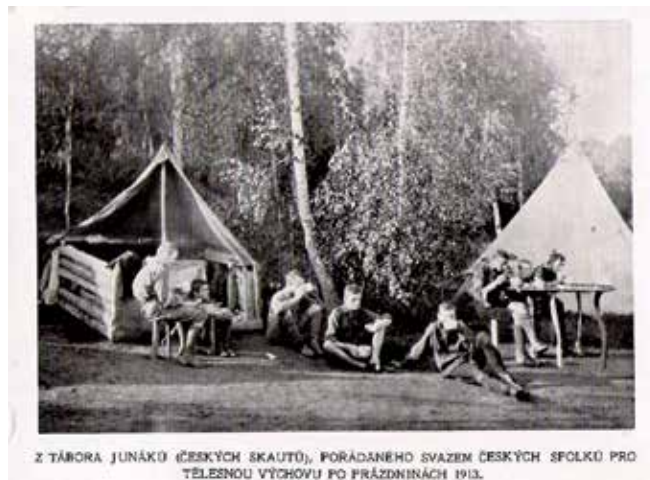
Z TÁBORA JUNÁKO (ČESKÝCH SKAUTŮ), PORÁDANÉHO SVAZEM ČESKÝCH SPOLKŮ PRO TELESNOU VÝCHOVU PO PRÁZDNINÁCH 1913.

Junák – český skaut Pulkrábkův tábor u Pelíškova mostu, 1913 Svojsíkův tábor 1914 Propagační pohlednice 1913